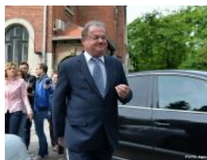
Vasile Blaga, despre Victor Ponta, care sustine construirea moscheei in Bucuresti: "Credem ca este un troc" 18 Iulie 2015