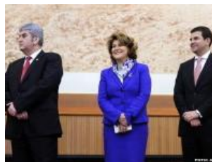
Sedinta a coalitiei de guvernare. Partidele de la putere discuta despre Codul Fiscal si salariile demnitarilor 19 Iulie 2015